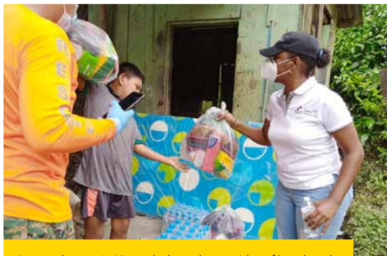
La ayuda consistió en bolsas de comidas, fórmulas de leches, kit de aseo, colchones, frazadas, entre otros insumos.

El MIDES ha desplegado a las áreas afectadas un equipo conformado por trabajadores sociales a fin de levantar un informe social de las repercusiones que generó las inundaciones ocasionadas por un sistema de baja presión en la provincia.